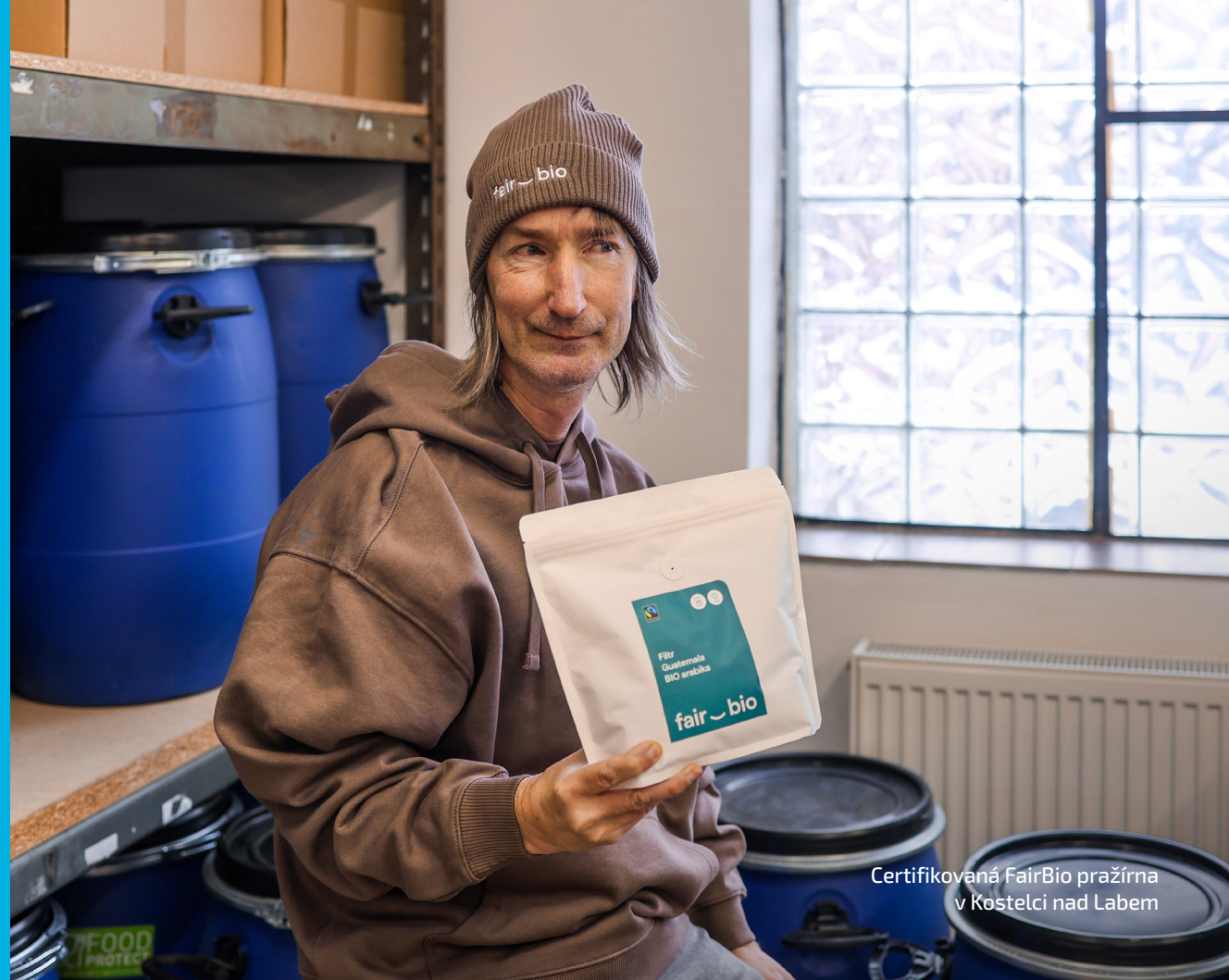
Certifikovaná FairBio pražírna v Kostelci nad Labem

Fairtrade je globální certifikační systém, do kterého je zapojeno více než 1,9 milionu pěstitelů a zaměstnanců z více než 1 800 organizací a družstev v 67 zemích světa. O zásadních otázkách fungování systému Fairtrade rozhodují také zástupci pěstitelských družstev a organizací, kteří disponují 50 % hlasů na Valné hromadě.