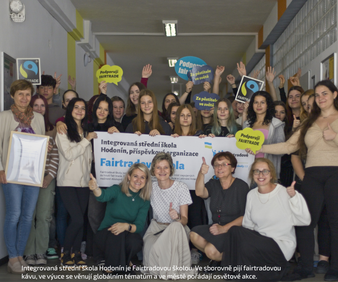
Integrovaná střední škola Hodonín je Fairtradovou školou. Ve sborovně pijí fairtradovou kávu, ve výuce se věnují globálním tématům a ve městě pořádají osvětové akce.