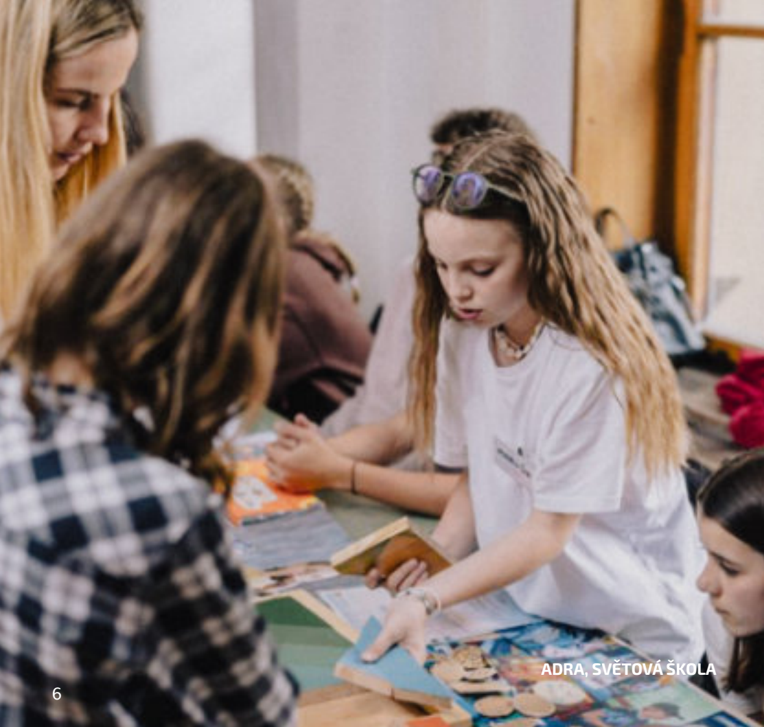
ADRA, SVĚTOVÁ ŠKOLA