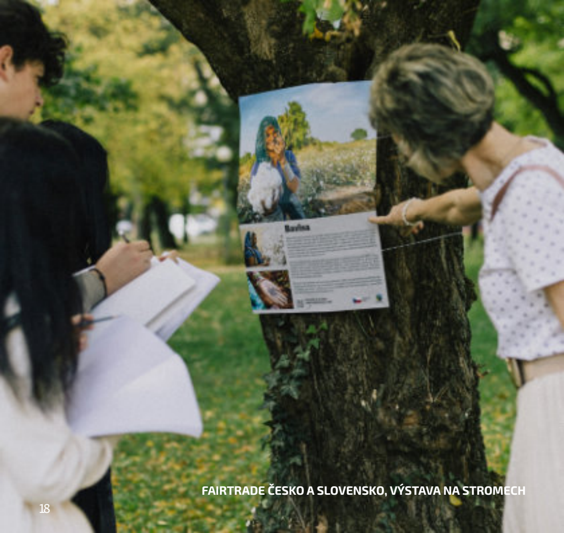
FAIRTRADE ČESKO A SLOVENSKO, VÝSTAVA NA STROMECH