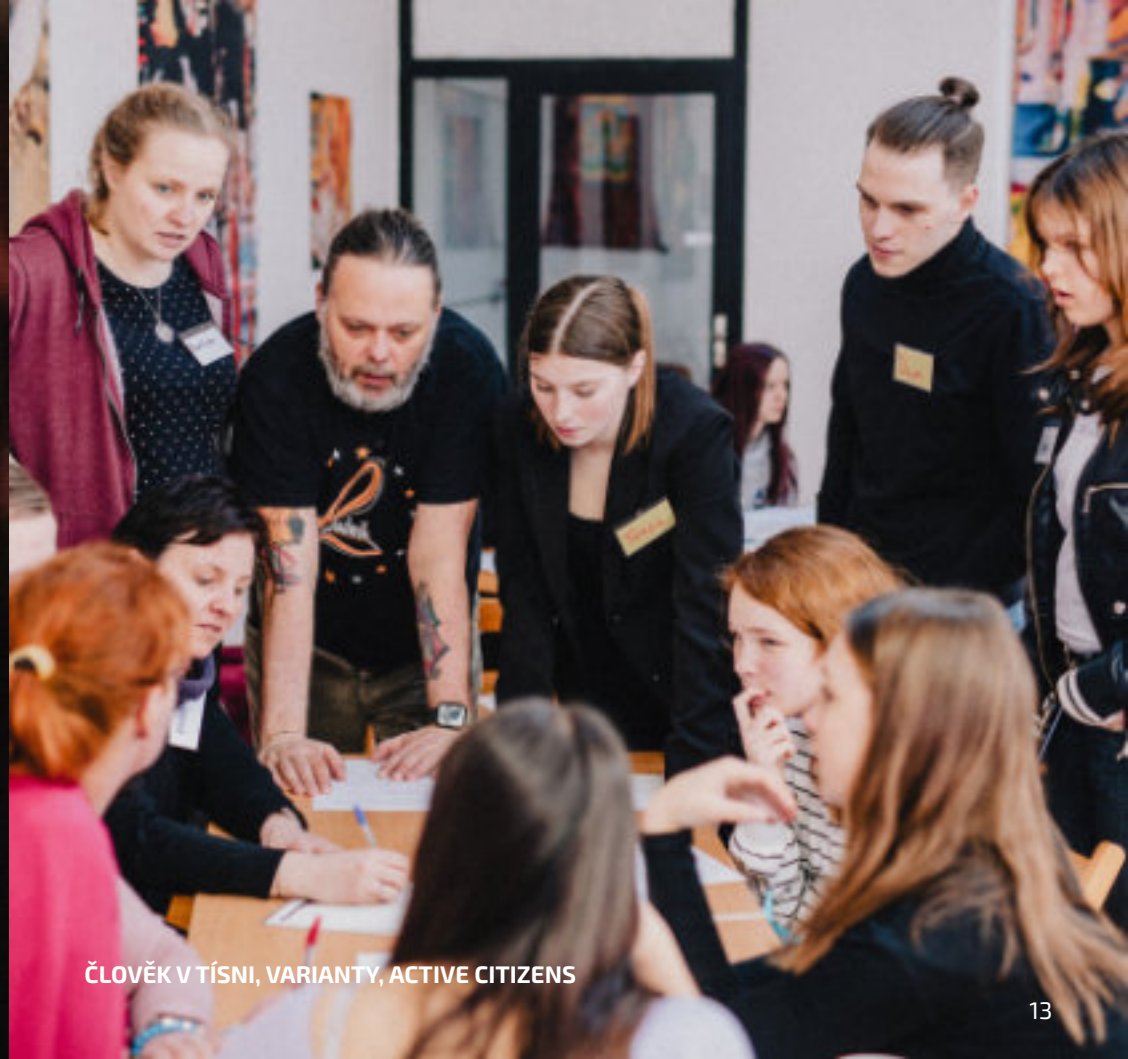
ČLOVĚK V TÍSNI, VARIANTY, ACTIVE CITIZENS