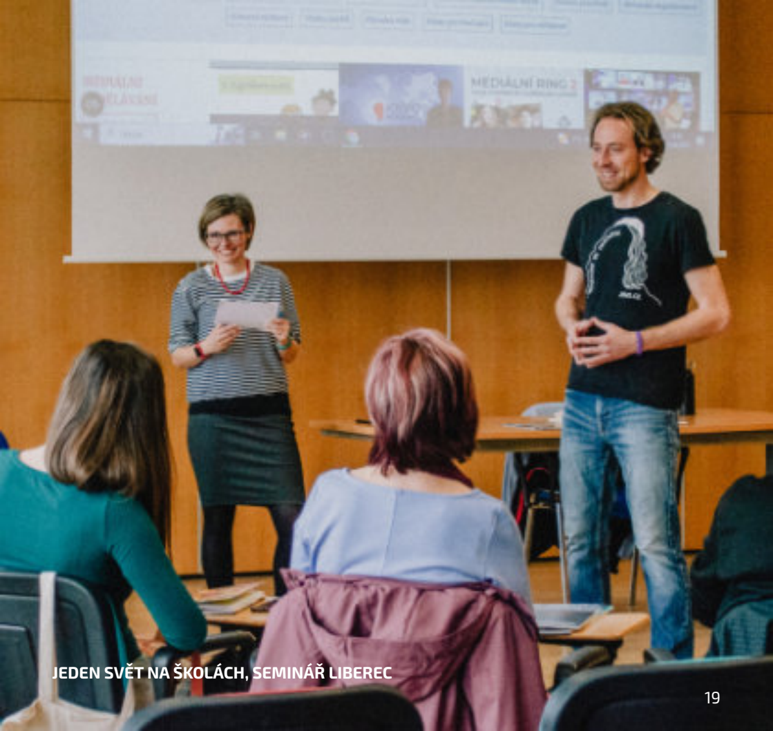
JEDEN SVĚT NA ŠKOLÁCH, SEMINÁŘ LIBEREC