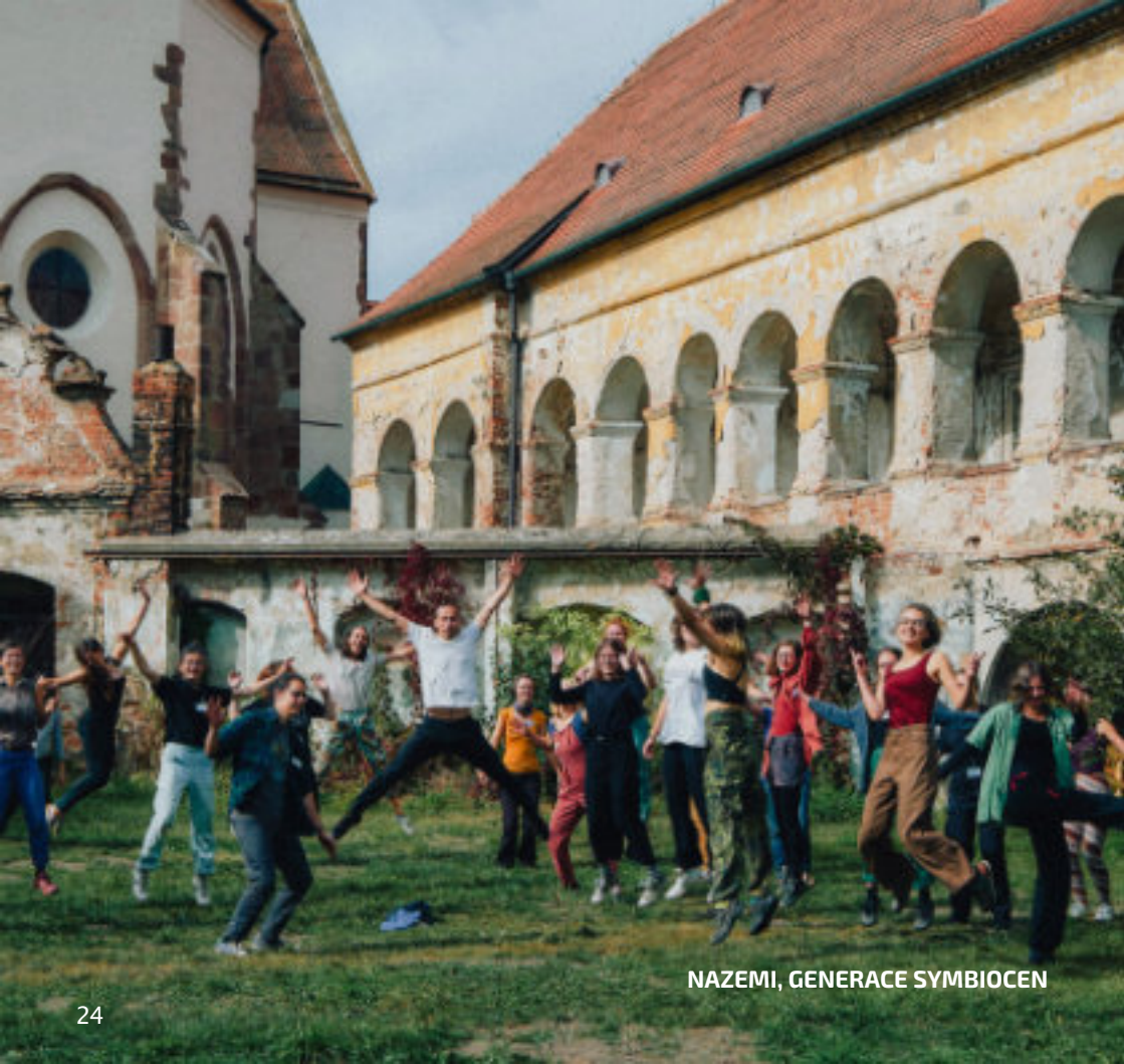
NAZEMI, GENERACE SYMBIOCEN