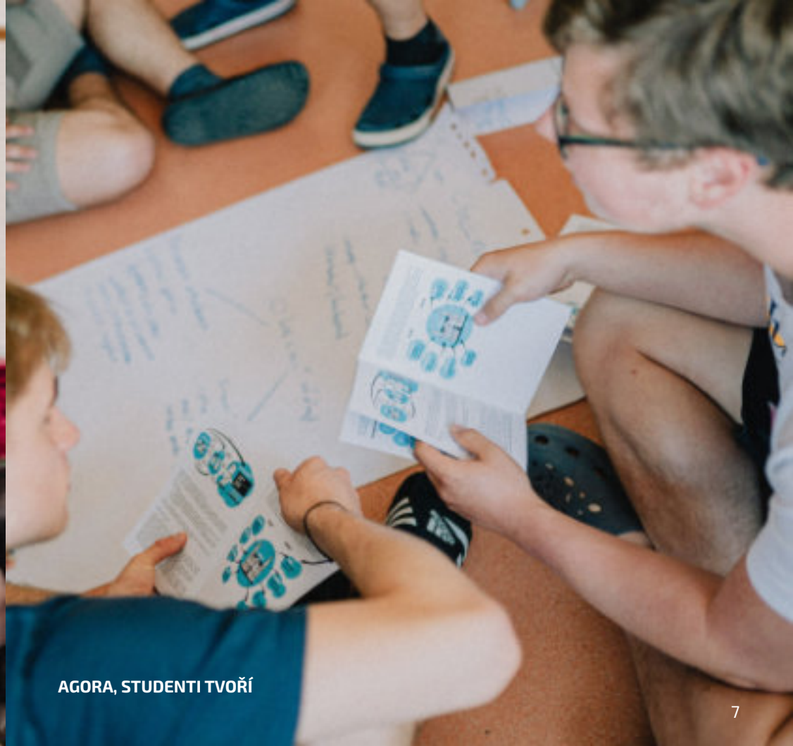
AGORA, STUDENTI TVOŘÍ